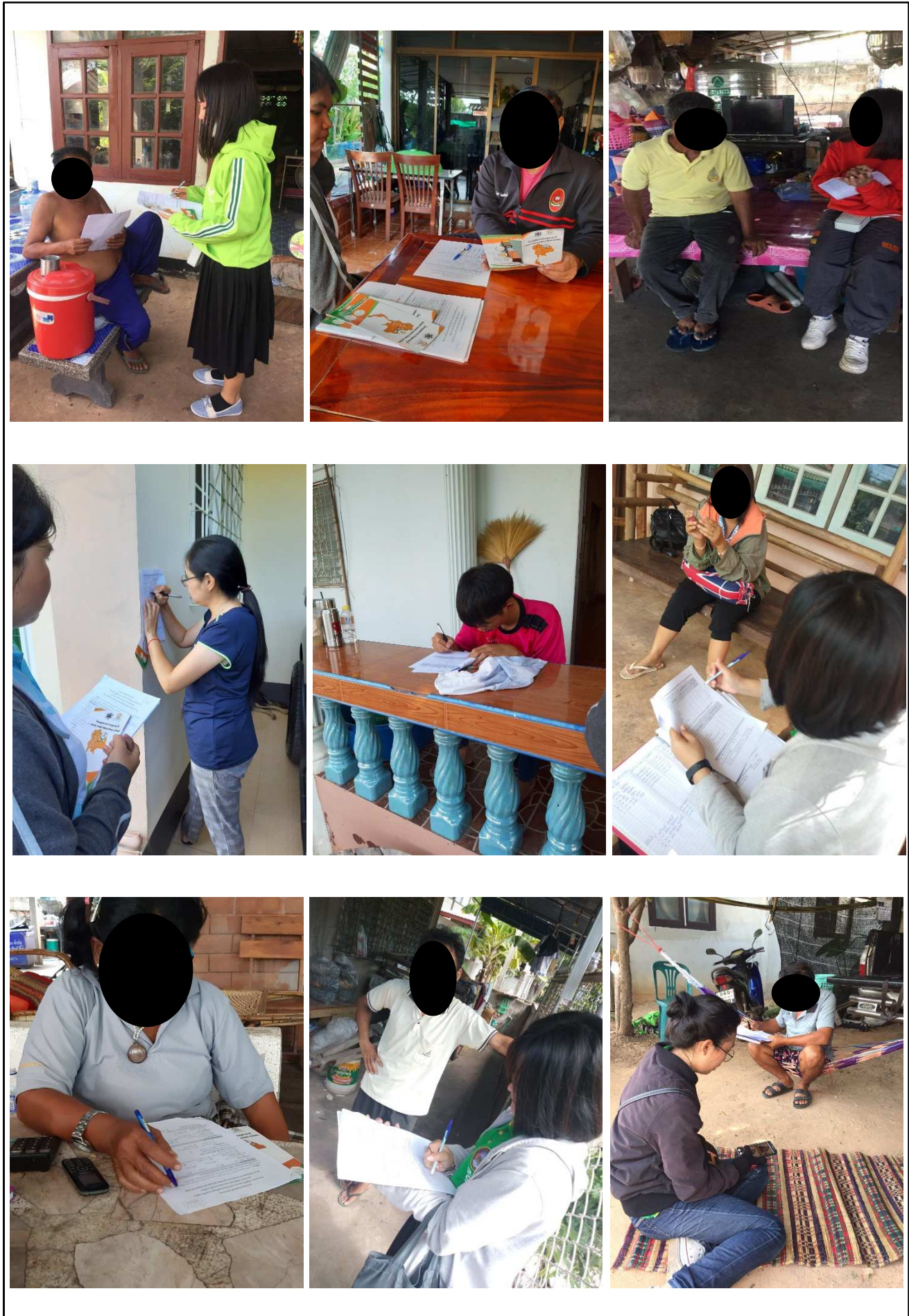
รูปที่ 3-1 : ตัวอย่างบรรยากาศการสำรวจความคิดเห็น