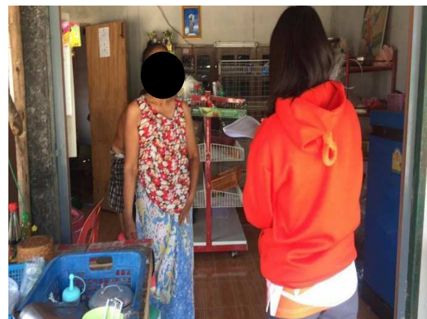
รูปที่ 3-1 (ต่อ) : ตัวอย่างบรรยากาศการสำรวจความคิดเห็น